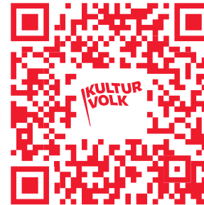
Schnell zur Website von Kulturvolk