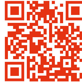
Kultur in Berlin und Brandenburg - eine App, alles im Blick