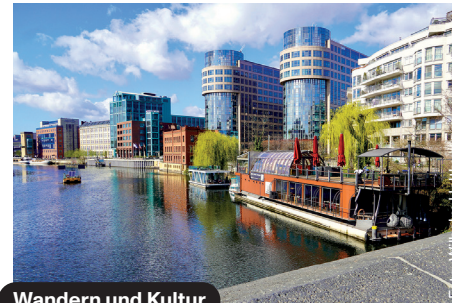
Wandern und Kultur

Kulturvolk – Garten / Ruhrstr. 6, 10709 Berlin